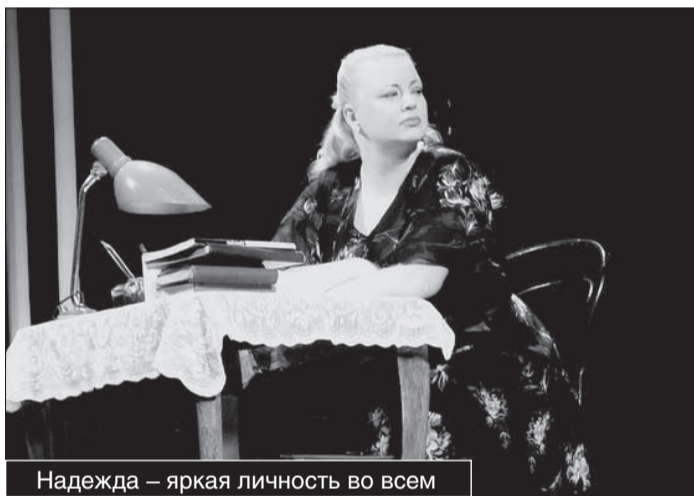
Надежда – яркая личность во всем

можно не опасаться упреков во вторичности. Его «Сестра Надежда» совершенно оригинальна и имеет собственное